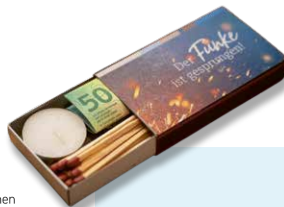
Zündende Ideen werden belohnt: Wer mit seinem Vorschlag Verbesserungen bewirkt, erhält als Dankeschön eine symbolische Zündholzschachtel.

«Im Mittelpunkt steht immer der Mensch mit seinen persönlichen Bedürfnissen, Gewohnheiten und Lebensgeschichten.»