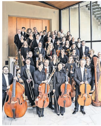
Das Orchester argovia philharmonic ist bei Muri Classics zu Gast.